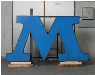
„M“ aus dem Schriftzug/Logo „MECCANO“. Neonschriftzug.

Das Ab- und Ausgiessen ist ein gebräuchliches Mittel der Archäologie (z.B. beim Ausgiessen von Hohlräumen, welche durch den Zerfall von organischem Material entstanden sind) und der Paläontologie (z.B. beim Abformen von Dinosaurierspuren oder der Versteinervorgang hin zum Fossil).