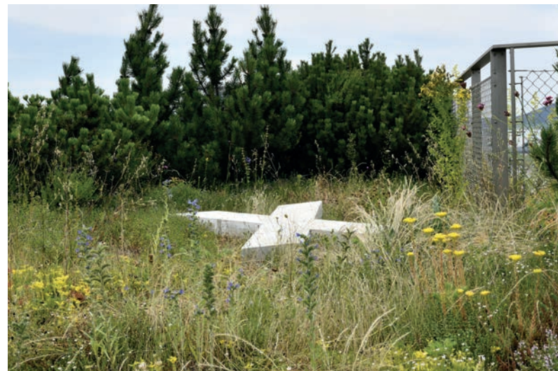
Terrasse 6. Stock, öffentlicher Teil