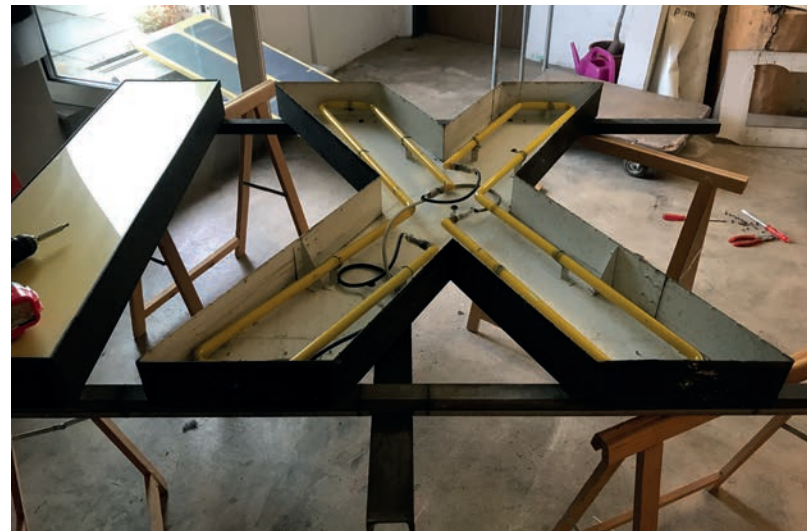
Beispiel: X aus TRIX EXPRESS Elektrik