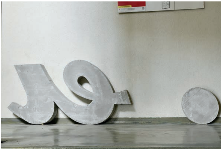
Treppenhaus 1. Stock