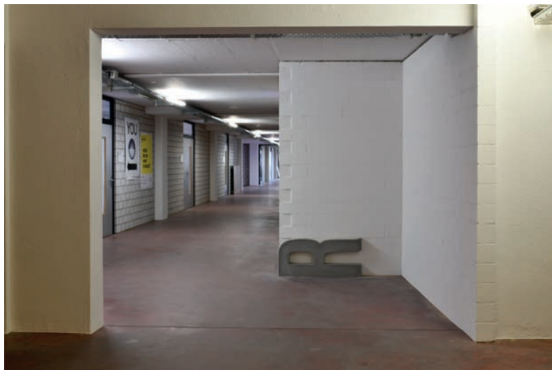
Gang 2. Stock, Anbau