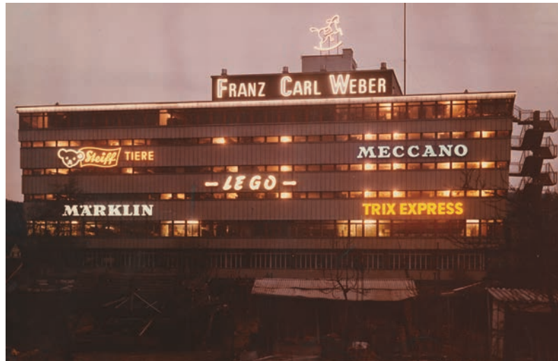
Fassadenansicht mit Leuchtreklamen.