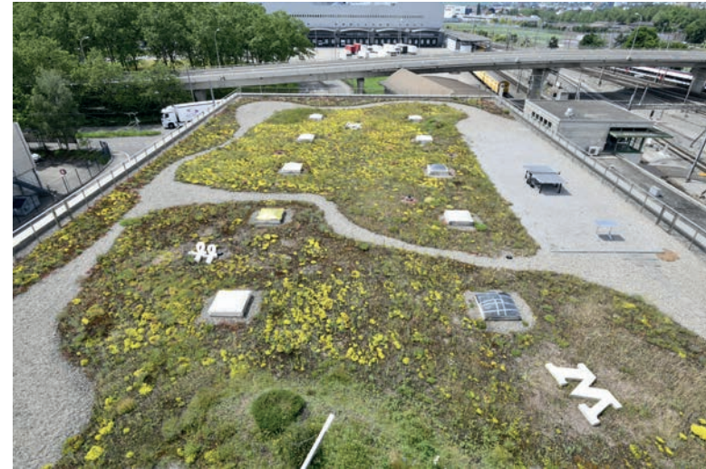
Auf der Terrasse 3. Stock wurden die meisten Objekte platziert. Eine Art archäologischer Park entstand. Ansicht vom 6. Stock.

TRIX EXPRESS beide Terrasse 6. Stock, öffentliche Seite MÄRKLIN Haufen Terrasse 3. Stock MECCANO M einzeln Terrasse 3. Stock, C auf Haufen Steiff TIERE ei 1. Stock Innenraum ff Terrasse 3. Stock T I 6. Stock, öffentliche Seite E 6. Stock, Seite Kantine FRANZ CARL WEBER B Haufen Terrasse 3. Stock R 2. Stock Innenraum