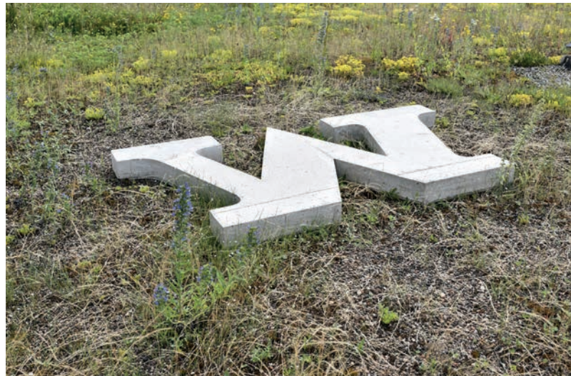
„M“ aus dem Schriftzug/Logo „MECHANO“. Dokumentation ausgegossener „Blechkasten“ vom Neonschriftzug. Terrasse 3. Stock.