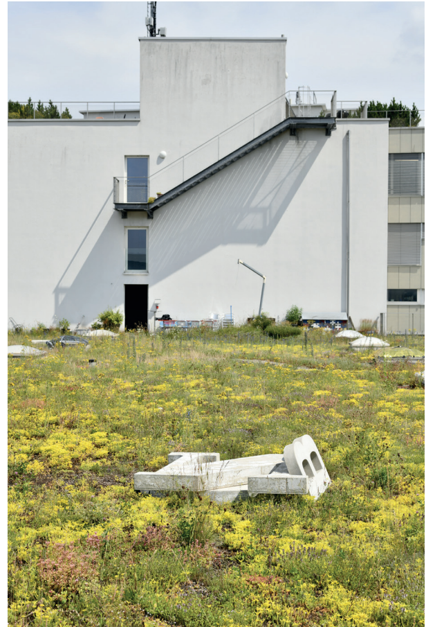
Terrasse 3. Stock