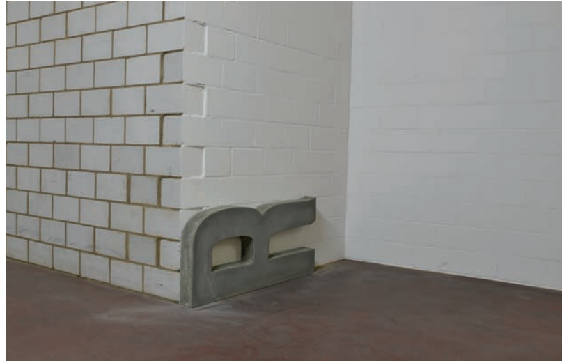
Gang 2. Stock, Anbau