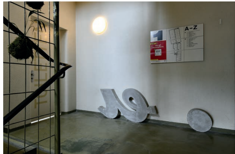
Treppenhaus 1. Stock