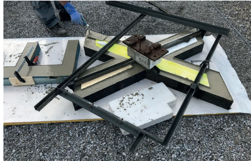
Beispiel: X aus TRIX EXPRESS Guss

Für die Gewichtsreduktion kann ein Styroporkern eingegossen werden. Querschnitt.